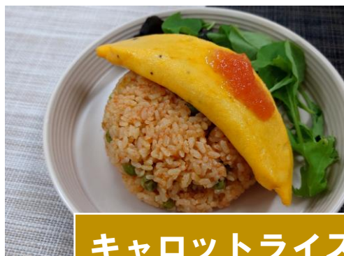
キャロットライス